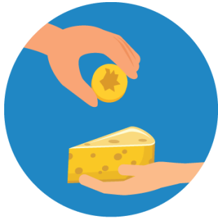
Medio de cambio