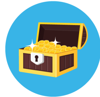
Depósito de valor