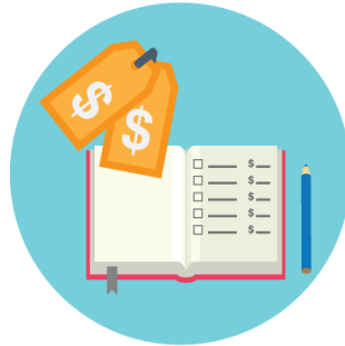
Unidad de cuenta